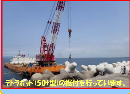
テトラポッド(50t型)の据付を行っています。

工事名：秋田港飯島地区防波堤(北)(改良) 消波工事(その2) 施工業者：株式会社 沢木組 工事内容：北防波堤の消波ブロック製作及び据付を行っています。 進捗状況：58.0% 工事期間：平成31年3月20日 ～ 令和元年10月31日