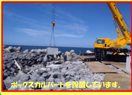
ボックスカルバートを設置しています。

工事名：向浜ふ頭用地造成工事 29-Z401-K5 施工業者：清水組・大森建設JV 工事内容：護岸の基礎を作っています。 進捗状況：95.0% 工事期間：平成30年3月30日 ～ 令和元年9月30日