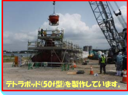
テトラポッド(50t型)を製作しています。

工事名：秋田港飯島地区防波堤(北)(改良) 消波工事 施工業者：長田建設 株式会社 工事内容：北防波堤の消波ブロックを製作しています。 進捗状況：68.1% 工事期間：令和元年5月27日 ～ 令和元年9月30日