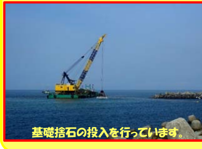
基礎捨石の投入を行っています。

工事名：向浜ふ頭用地造成工事 31-Z401-20 施工業者：加藤組・杉本組JV 工事内容：向浜ふ頭用地の護岸を作ります。 進捗状況：37.0% 工事期間：令和元年5月17日 ～ 令和元年9月20日