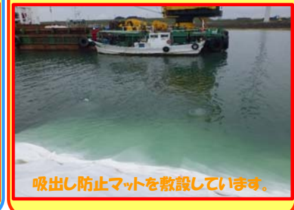
吸出し防止マットを敷設しています。

工事名：向浜ふ頭用地造成工事 29-Z401-K1 施工業者：杉本組・加藤組JV 工事内容：仮設ヤードの造成を行っています。 進捗状況：75.0% 工事期間：平成30年3月30日 ～ 令和元年9月30日