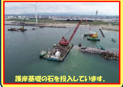
護岸基礎の石を投入しています。

工事名：向浜ふ頭用地造成工事 31-Z401-10 施工業者：加藤建設・広洋産業JV 工事内容：ふ頭用地を造成しています。 進捗状況：55.0% 工事期間：令和1年5月17日 ～ 令和元年9月20日