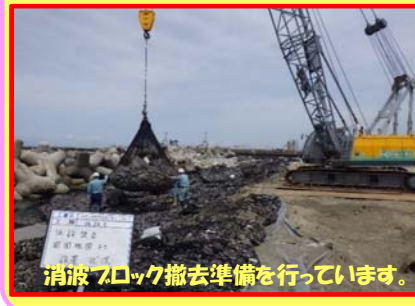
消波ブロック撤去準備を行っています。

工事名：向浜ふ頭用地造成工事 30-Z401-20 施工業者：三和興業株式会社 工事内容：消波ブロックを撤去します。 進捗状況：12.0% 工事期間：令和1年6月21日 ～ 令和元年10月28日