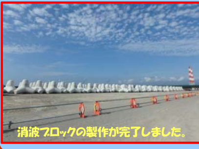
消波ブロックの製作が完了しました。

工事名：秋田港飯島地区防波堤(北)(改良) 消波工事(その3) 施工業者：株式会社 英明工務店 工事内容：北防波堤の消波ブロックを製作しています。 進捗状況：99.4% 工事期間：平成31年3月20日 ～ 令和元年8月9日