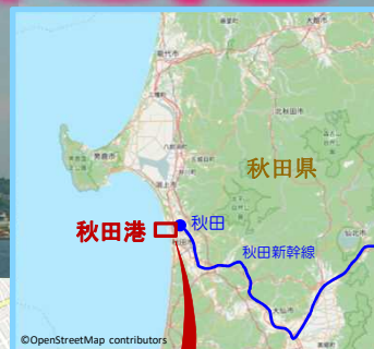
ポートタワーセリオン