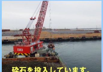
砕石を投入しています。

工事名 : 秋田港本港地区航路泊地 (埋設) 浚渫工事 施工業者 : (株)清水組 工事内容 : 航路泊地の浚渫を行っています。 進捗状況 : 98.0% 工事期間 : 令和2年8月17日 ~ 令和3年3月19日