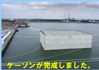
ケーソンが完成しました。

工事名 : 秋田港外港地区防波堤 (第二南) 本体工事 施工業者 : あおみ建設株式会社 工事内容 : 防波堤の製作工事を行っています。 進捗状況 : 99.7% 工事期間 : 令和2年6月11日 ~ 令和3年3月10日