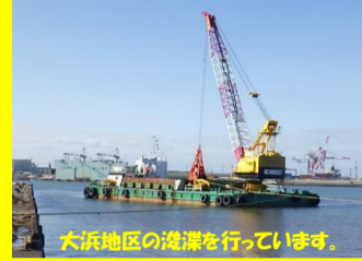
大浜地区の浚渫を行っています。

工事名 : 県単港湾整備工事 02-0251-10 施工業者 : 株式会社 加藤建設 工事内容 : 秋田港管内の浚渫を行っています。 進捗状況 : 87.0% 工事期間 : 令和2年8月7日 ~ 令和3年3月22日