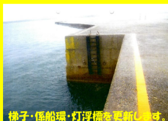
梯子・係船環・灯浮標を更新します。

工事名 : 県単港湾整備工事 01-0251-50 施工業者 : 広洋産業株式会社 工事内容 : 老朽化した港湾設備改修を行います。 進捗状況 : 5.0% 工事期間 : 令和2年12月11日 ~ 令和3年3月24日