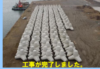
工事が完了しました。

工事名 : 秋田港外港地区防波堤(南)(改良) 消波工事 施工業者 : (株)清水組 工事内容 : 消波ブロックの製作を行っています。 進捗状況 : 100.0% 工事期間 : 令和2年7月27日 ~ 令和3年2月26日