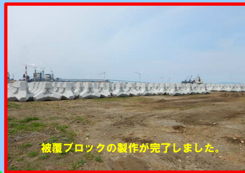
被覆ブロックの製作が完了しました。

工事名: 秋田港外港地区防波堤(南)(改良)被覆外工事 施工業者: 株式会社 伊藤羽州建設 工事内容: 被覆・消波ブロックを製作しています。 進捗状況: 76.0% 工事期間: 平成 29年 11月 28日~平成 30年 7月 10日