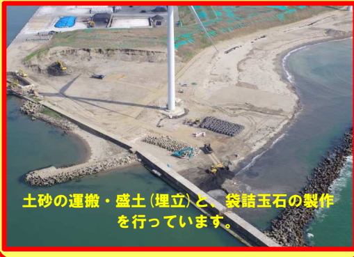
土砂の運搬・盛土(埋立)と、袋詰玉石の製作を行っています。

工事名: 向浜ふ頭用地造成工事 29-2401-20 施工業者: 株式会社 伊藤羽州建設 工事内容: 仮設ヤードの造成を行っています。 進捗状況: 48.0% 工事期間: 平成 29年 9月 12日~平成 30年 6月 27日