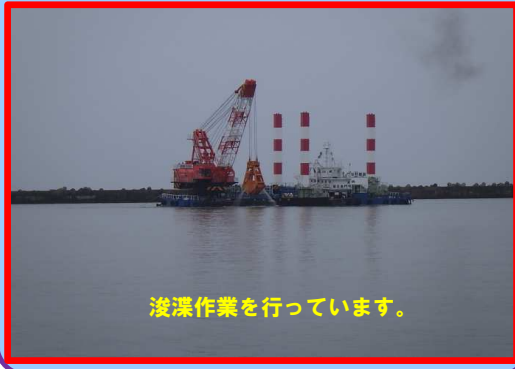
浚渫作業を行っています。

工事名: 秋田港本港地区航路泊地(埋没)浚渫工事 施工業者: 高橋秋和建設 株式会社 工事内容: 浚渫作業を行っています。 進捗状況: 92.0% 工事期間: 平成 29年 12月 5日~平成 30年 6月 15日