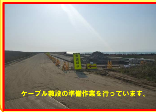
ケーブル敷設の準備作業を行っています。

工事名: 向浜ふ頭用地造成工事 29-2401-30 施工業者: 三和興業 株式会社 工事内容: 波高計のケーブルの移設を行っています。 進捗状況: 16.0% 工事期間: 平成 29年 11月 24日~平成 30年 6月 27日