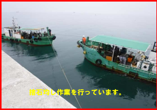
捨石均し作業を行っています。

工事名: 秋田港外港地区防波堤(第二南)築造工事 施工業者: りんかい日産建設 株式会社 工事内容: 第二南防波堤を作っています。 進捗状況: 6.0% 工事期間: 平成 30年 3月 7日~平成 30年 11月 30日