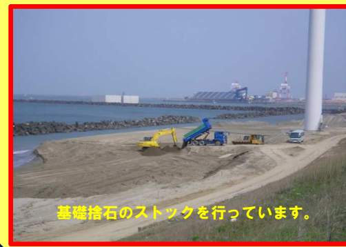
基礎捨石のストックを行っています。

工事名: 向浜ふ頭用地造成工事 29-2401-10 施工業者: 板橋組・秋田渥青建設特定JV 工事内容: 仮設ヤード造成工 基礎捨石ストックを行っています。 進捗状況: 34.9% 工事期間: 平成 29年 9月 12日~平成 30年 6月 27日