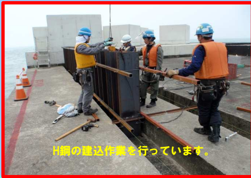
H鋼の建込作業を行っています。

工事名: 秋田港外港地区防波堤(第二南)上部工事 施工業者: 長田建設 株式会社 工事内容: 第二南防波堤の上部工を作っています。 進捗状況: 9.2% 工事期間: 平成 30年 3月 15日~平成 30年 8月 30日