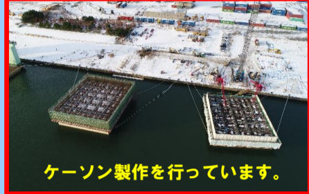
ケーソン製作を行っています。

工事名:秋田港外港地区防波堤(第二南)本体工事 施工業者:あおみ建設 株式会社 工事内容:第二南防波堤のケーソンを製作しています。 進捗状況:57.5% 工事期間:平成 29年 7月 21日～ 平成 30年 3月 23日