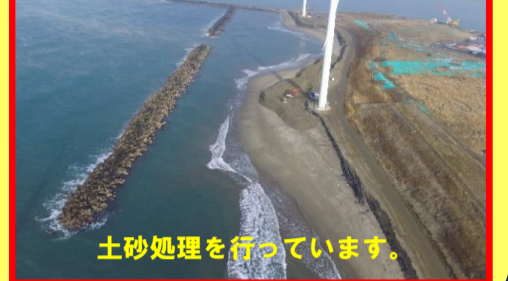
土砂処理を行っています。

工事名:向浜ふ頭用地造成工事 29-2401-10 施工業者:板橋組・秋田瀝青建設特定JV 工事内容:仮設ヤードの造成を行っています。 進捗状況:6.0% 工事期間:平成 29年 9月 12日～ 平成 30年 3月 23日