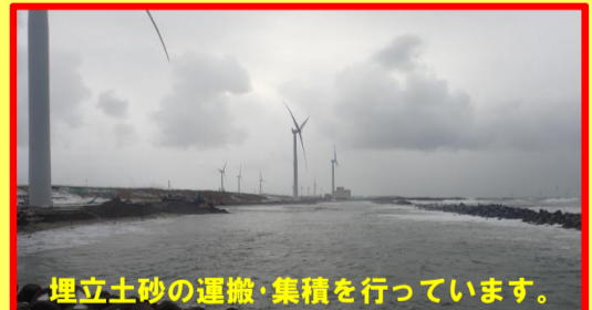
埋立土砂の運搬・集積を行っています。

工事名:向浜ふ頭用地造成工事 29-2401-20 施工業者:株沢木組・株加藤建設JV 工事内容:仮設ヤードの造成を行っています。 進捗状況:5.0% 工事期間:平成 29年 9月 12日～ 平成 30年 3月 23日