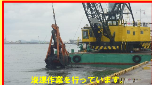
浚渫作業を行っています。

工事名:県単港湾整備工事 29-0251-10 施工業者:株式会社 加藤組 工事内容:浚渫作業を行っています。 進捗状況:80.0% 工事期間:平成 29年 7月 14日～ 平成 30年 2月 9日