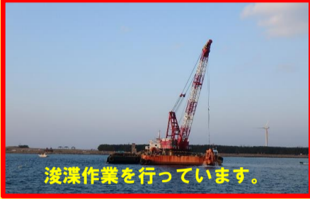
浚渫作業を行っています。

工事名:重要港湾改修工事29-PA10-30 施工業者:株式会社 沢木組 工事内容:浚渫作業を行っています。 進捗状況:81.5% 工事期間:平成 29年 8月 25日～ 平成 30年 1月 31日