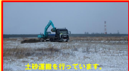
土砂運搬を行っています。

工事名:28-2501-50 臨海部土地造成工事 施工業者:有限会社 TAGUCHIコーポレーション 工事内容:土砂運搬を行っています。(飯島～向浜) 進捗状況:25.0% 工事期間:平成 29年 11月 17日～ 平成 30年 1月 31日