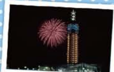
5 みなとオアシスあきた ～秋田港海の祭典～