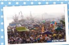
2 みなとオアシス八戸 ～八戸館側岸壁朝市～