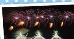
10 みなとオアシスいわき小名浜 ～いわき港花火大会～