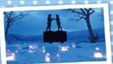
11 みなとオアシス十和田湖 ～7女の像～