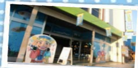
3 もぐらんぴあみなとオアシス ～まちなか水族館～