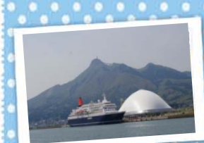
13 みなとオアシスおおしまと ～しもきた克雪ドーム～