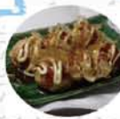
Sea 級グルメ 【宮古】 真崎焼き