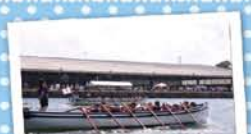
4 みなとオアシスみやこ ～カッターレース～