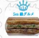
Sea 級グルメ 【宮古】 サーモンスティック