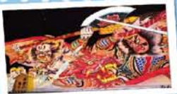
1 みなとオアシスあおもり ～青森ウォーターフロント～