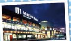
5 マリンゲート塩釜 ～フェリーターミナル～