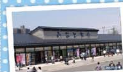
8 みなとオアシス酒田 ～みなと市場～