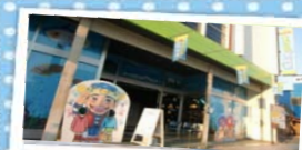
3 もくらんぴあみなとオアシス ～まちなか水族館～