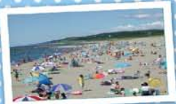
7 みなとオアシスほんじょう ～本荘マリーナ海水浴場～