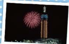
5 みなとオアシスあきた ～秋田港海の祭典～