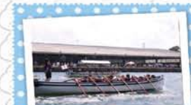
4 みなとオアシスみやこ ～カッターレース～