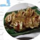
Sea 級グルメ 【宮古】 真崎焼き