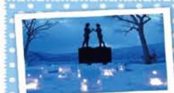
11 みなとオアシス十和田湖 ～7女の像～