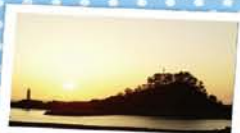
9 みなとオアシス蛸ヶ関 ～夕焼けの弁天島～

QRコードがついて いるから、気になる オアシス情報を簡単に チェックできるよ！