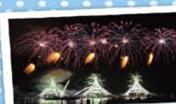
10 みなとオアシスいわき小名浜 ～いわき港花火大会～