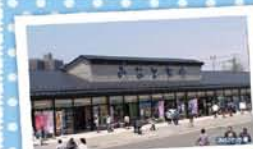
8 みなとオアシス酒田 ～みなと市場～