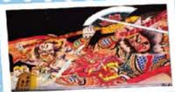
1 みなとオアシスあおもり ～青森ウォーターフロント～