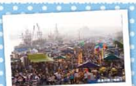
2 みなとオアシス八戸 ～八戸館側岸壁朝市～