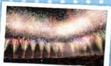
12 みなとオアシス船川 ～男鹿日本海花火～