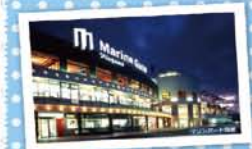
5 マリンゲート塩釜 ～フェリーターミナル～