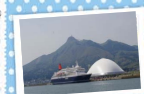
13 みなとオアシスおおみやと ～しもきた克雪ドーム～