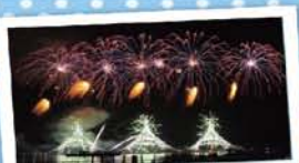
10 みなとオアシスいわき小名浜 ～いわき港花火大会～