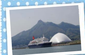
13 みなとオアシスおおしまと ～しもきた克雪ドーム～