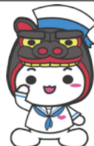
酒田市マスコット キャラクター もしえのん