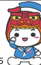
酒田市マスコット キャラクター あなのん