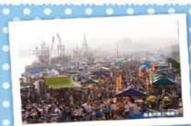
2 みなとオアシス八戸 ～八戸館側岸壁朝市～