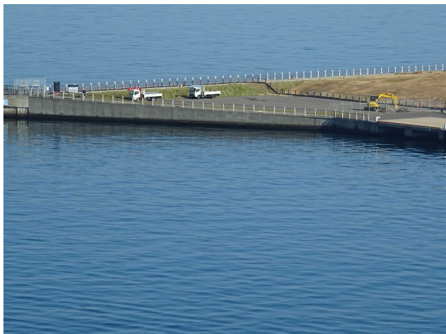
平成28年11月14日 工事着手