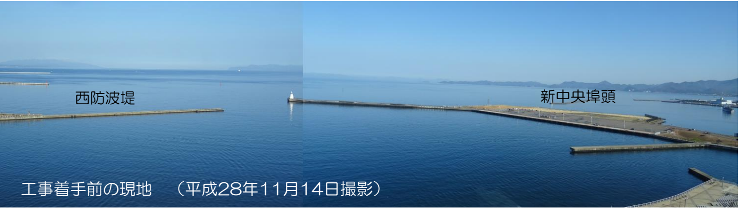
工事着手前の現地 (平成28年11月14日撮影)