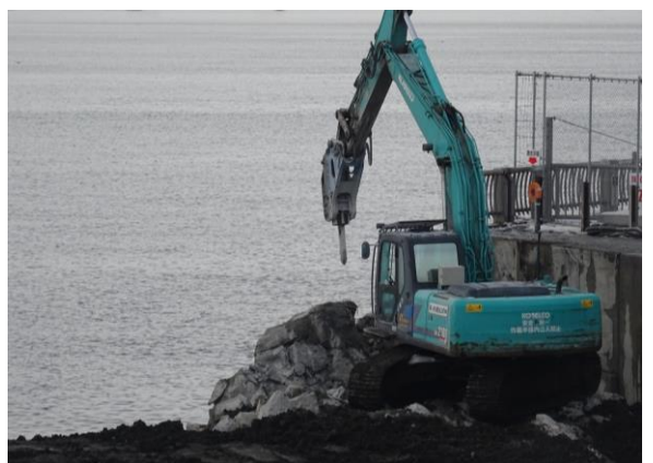
コンクリート構造物を破碎する油圧ブレーカ