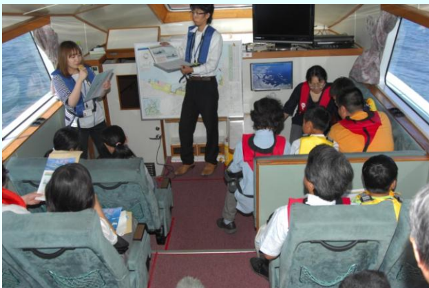
▲船内にて概要説明

今回の見学会を通じて、改めて津波の被害の大きさを実感し、また、港の復旧状況を十分に知っていただけたのではないかと思います。