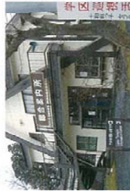
十和田湖総合案内所