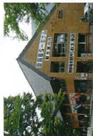
遊覧船ターミナル