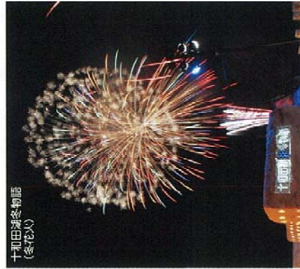
十和田湖冬物語 (冬花火)