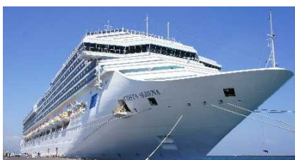
▲青森港に入港したコスタ・セレーナ