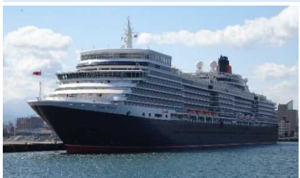
▲青森港に入港したクイーン・エリザベス