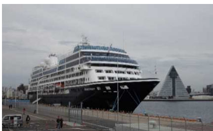
▲青森港に入港したアザマラ・クエスト