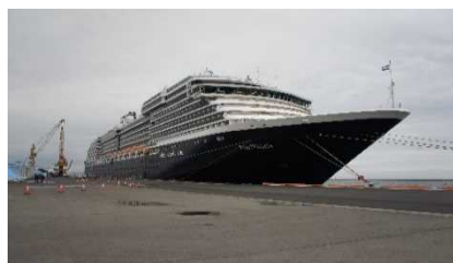
▲青森港に入港したウエステルダム