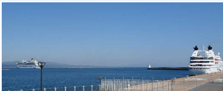
▲2隻同時寄港（右：スター・レジェンド 左：コスタ・セレーナ）