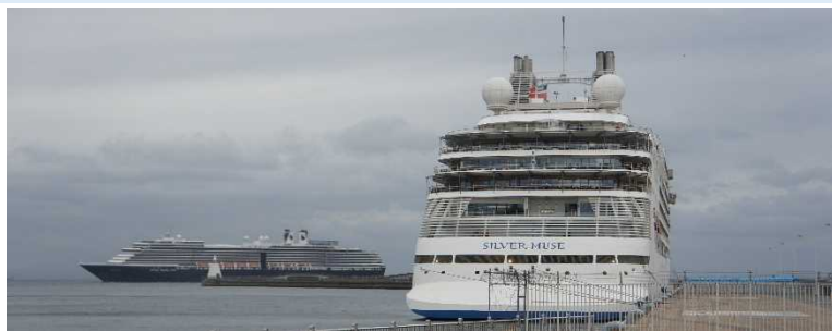
▲2隻同時寄港（手前：シルバー・ミュージック 奥：ウエステルダム）

・4月26日（金）、青森港にホーランド・アメリカ・ライン社の「ウエステルダム（オランダ船籍）」、シルバーシー・クルーズ社の「シルバー・ミュージック（バハマ船籍）」が初寄港しました。両船は東北としても初寄港となります。 ・ウエステルダムは、横浜を出発し、高知や金沢、函館などを巡る「横浜発着クルーズ14泊」での寄港となります。 ・シルバー・ミュージックは、東京を出発し、鹿児島や釜山、函館などを巡る「東京発着クルーズ」での寄港となります。