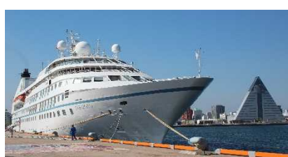
▲青森港に入港したスター・レジェンド