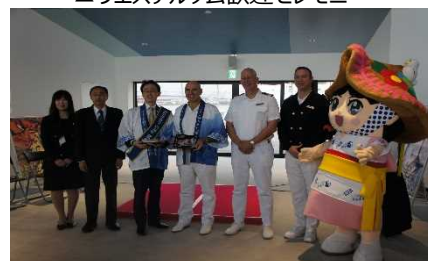
▲シルバー・ミュージック歓迎セレモニー