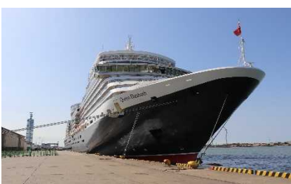
▲秋田港に入港したクイーン・エリザベス