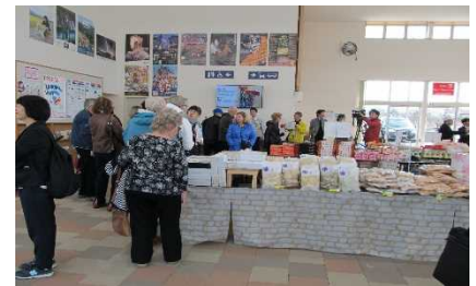
▲ターミナルを利用する乗船客