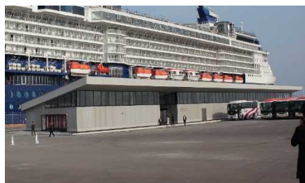
▲青森港国際クルーズターミナル