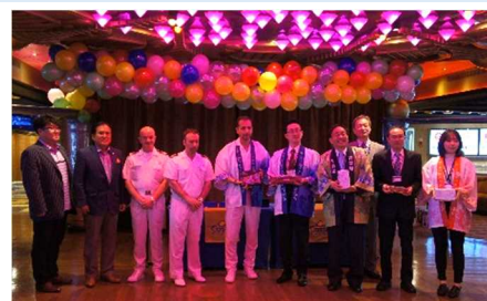
▲コスタ・セレーナ歓迎セレモニー