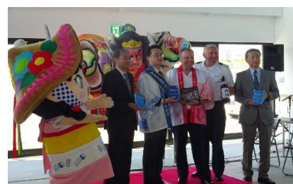
▲スター・レジェンド歓迎セレモニー