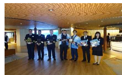
▲ウエステルダム歓迎セレモニー