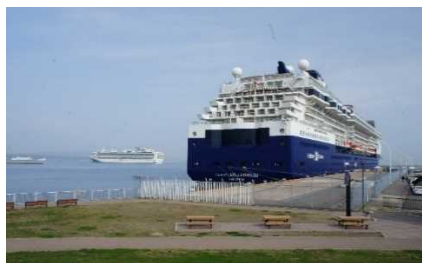
▲2隻同時入港（手前：セブリティ・イミレニアム 奥：ダイヤモンド・プリンセス）

・4月24日（水）、青森港で今年初となるクルーズ船の寄港（セブリティ・イミレニアム、ダイヤモンド・プリンセスの2隻同時寄港）に合わせて、クルーズ客の利便性向上を目的として整備した「青森港国際クルーズターミナル」供用開始式典を開催しました。