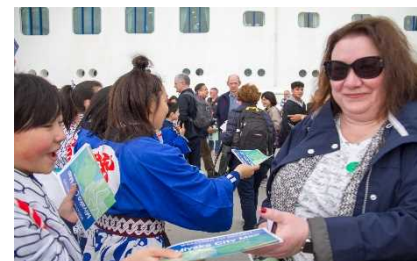
▲地元学生らによる「おもてなし」