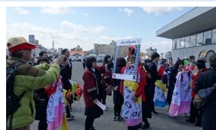
▲地元学生らによる「おもてなし」