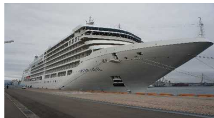
▲青森港に入港したシルバー・ミュージック