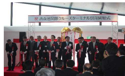
▲来賓等によるテープカット