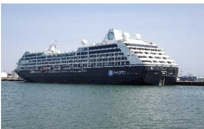
▲秋田港に入港したアザマラ・クエスト