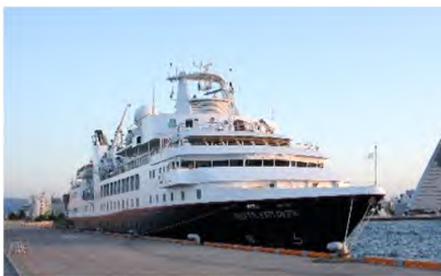
▲青森港に入港したシルバー・エクスプローラー