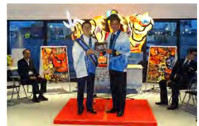
▲青森港 記念品贈呈