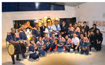
▲青森港 歓迎セレモニー