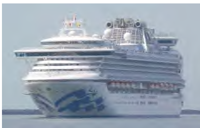
▲入港したダイヤモンド・プリンセス