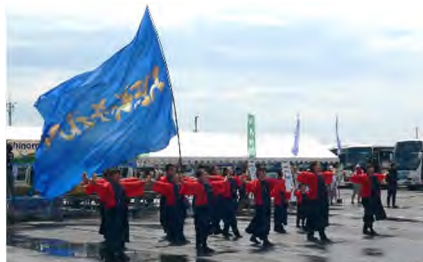
▲入港イベント「よさこい演舞」