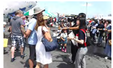
▲東北地方整備局職員による通訳ボランティア