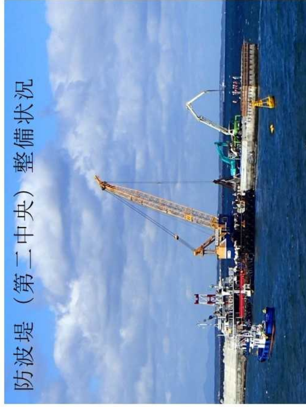
防波堤（第二中央）整備状況