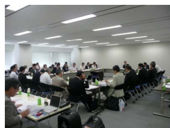
津波・震災対策技術検討委員会

震災から約4ヶ月が経過し、最近では、貨物船やコンテナ船第1船入港などがニュースとして取り上げられるなど、明るい話題が増えてきております。震災で被害を受けた港湾が完全に復旧するには、しばらく時間がかかりそうですが、引き続き一日も早い復旧・復興に向け取り組んで参ります。