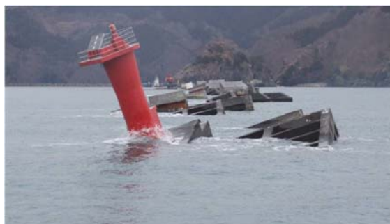
被災後の釜石港湾口防波堤

平成23年3月11日14時46分、三陸沖を震源とする国内観測史上最大となるマグニチュード9.0の東北地方太平洋沖地震が発生しました。この巨大地震により宮城県で最大震度7、東北の他県でも最大震度5強以上の揺れを観測し、その後、この地震により発生した津波により東北を中心とした東日本の太平洋沿岸部において、多くの尊い命が失われるなど、これまで私たちが経験したことの無い未曾有の大災害となりました。今回の大震災で被災された方々に心よりお見舞いを申し上げます。