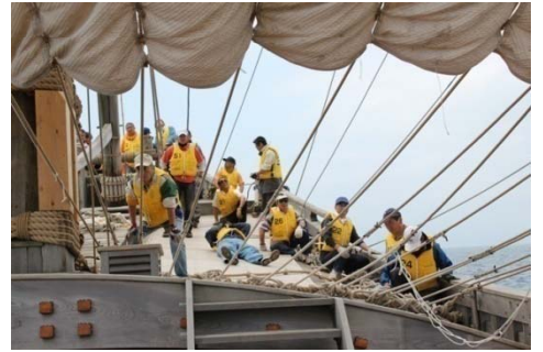
帆を張る参加者たち

みちのく丸の帆走には、20～30名の操船者が必要ですが、青森から乗船する操船経験者は10名弱であり、安全な航海のためには各地から応援の参加者が必要となります。各地から延べ30名ほどが、6月までに計4日間青森湾で実際に帆を張り、操船技術を学びました。参加者たちは、船内で「おい〇番あっちに綱を」など普段の職業や立場に関係なく、全員番号で呼ばれ指導を受けていました。暗くて暑い下層から中層、甲板と一通り操船した後、参加者は本物でしか味わえない感動とともに地元に戻っていきました。江戸時代の操船技術が青森から各地に伝わることとなります。7月13日に青森を出港し、各地で行われる船内見学などが多くの人々を魅了することになるでしょう。全48日間の航海の安全を願っています。