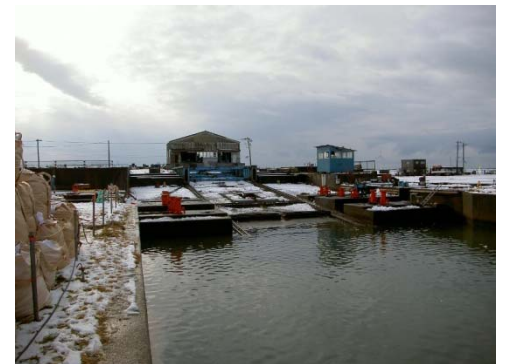
撤去前のケーソンヤード

今後の酒田港整備にあたって、ケーソンヤードを利用する予定がないことから、最終ケーソン製作終了後の今年3月29日の撤去工事完了により、酒田港の発展に重要な役割を果たしてきたその歴史に幕を閉じました。