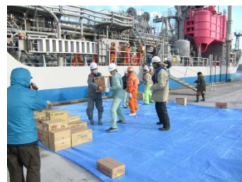
支援物資の陸揚げ状況(大船渡港)

東北地方整備局では、地震発生と同時に災害対策本部(非常体制)を設置し、災害対応業務にあたりました。当局管内の太平洋側の港湾では、地震・津波による港湾施設の被害に加え、津波によって流されたがれきや浮遊物が港内に散乱しており、すぐに緊急物資などを積んだ船が接岸できない状況でした。このため、港湾空港部では、被害の大きかった東北太平洋沿岸の各港湾について、日本埋立浚渫協会等の協力のもと、ただちに航路啓開作業を実施しました。その結果、3月16日には宮古港及び釜石港で支援物資の陸揚げが行われ、同23日には被災を受けた10港全てで一部岸壁等において海上からの支援物資の受け入れが可能となりました。