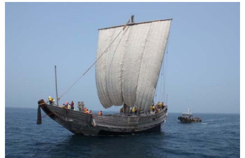
帆走するみちのく丸

※詳しくはみちのく北方漁船博物館HP http://www.mtwbm.com/ をご覧ください。