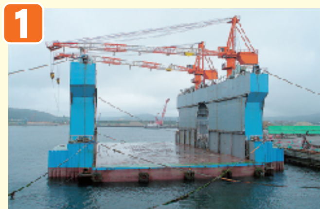
●ケーソン製作前 (フローティングドック)