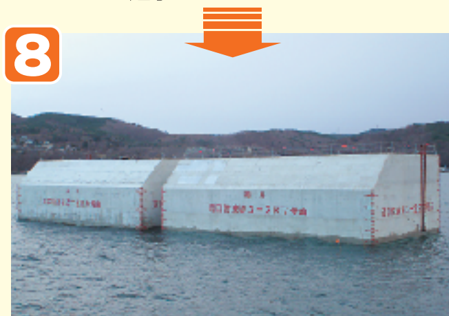
●ケーソン仮置き完了 (仮置場)