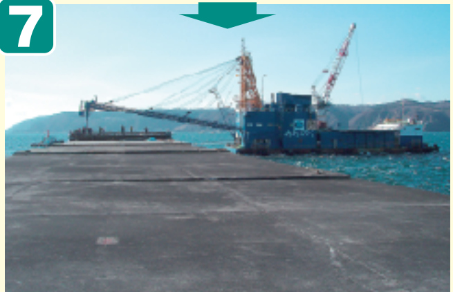
●上部コンクリート打設 (暫定)