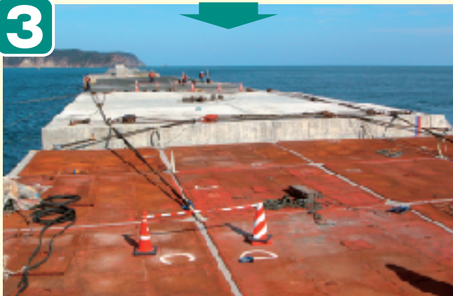
●据付開始 (ワイヤーリング作業)