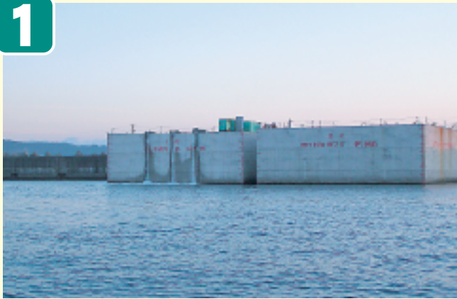
●ケーソン内排水・浮上