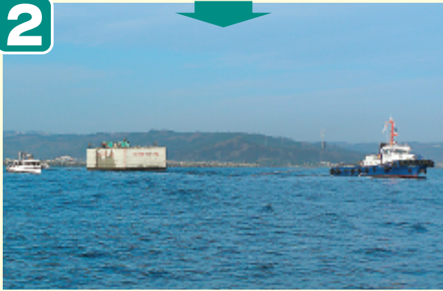
●タグボートによるえい航