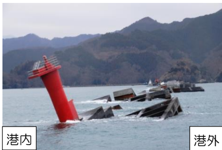
【写真】 北堤の倒壊状況