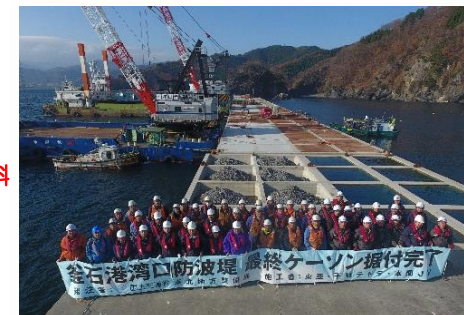
平成29年11月 最終ケーソンの据付完了