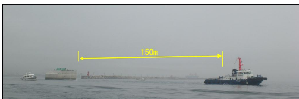
ケーソン曳航イメージ