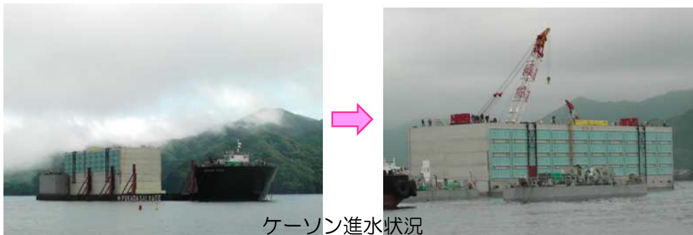
ケーソン進水状況

当事務所では東日本大震災により被災した釜石港の災害復旧工事を鋭意進めているところです。特に甚大な被害を受けた釜石港湾口防波堤の本体となるハイブリッドケーソンについては、昨年3月より名古屋港内にて製作してまいりました。