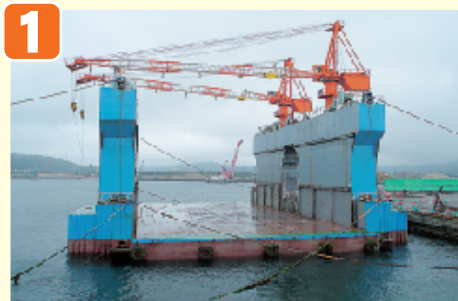
●ケーソン製作前 (フローティングドック)