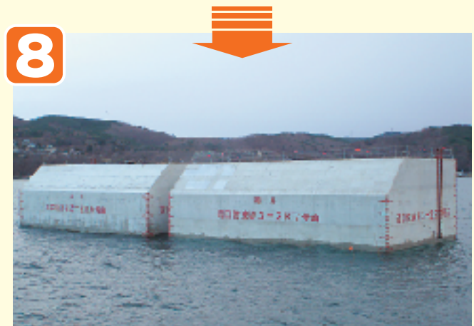
●ケーソン仮置き完了 (仮置場)