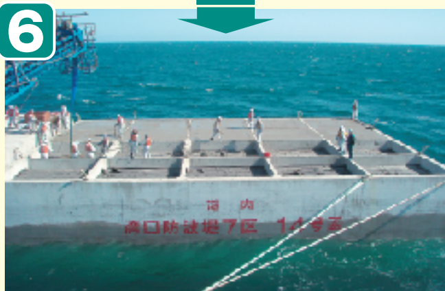
●蓋コンクリート打設