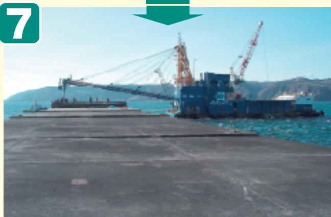
●上部コンクリート打設 (暫定)