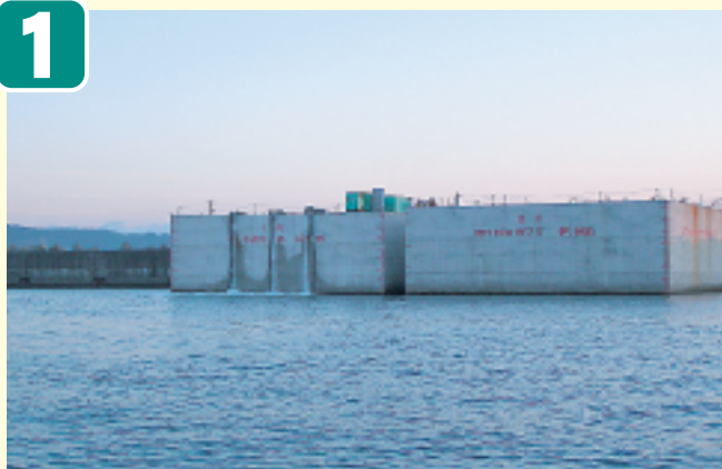
●ケーソン内排水・浮上