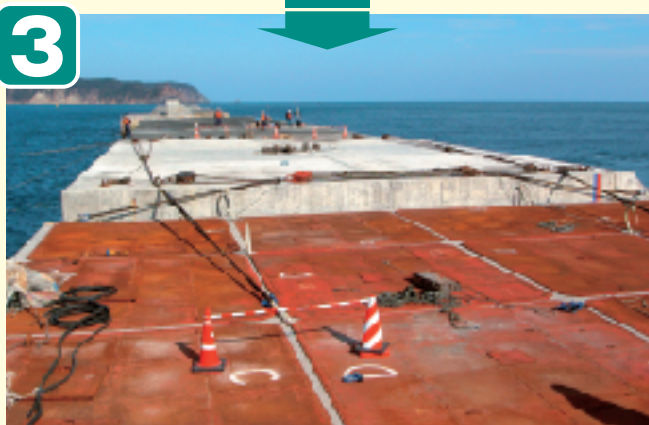
●据付開始 (ワイヤーリング作業)