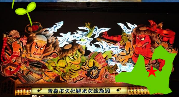
青森市文化観光交流施設