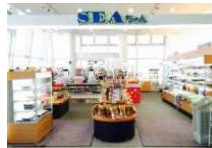
1F売店「SEAちゃん青森店」

青森～函館航路は1日8往復、16便で24時間365日運航中！ターミナルは乗船者以外もご利用頂けます。