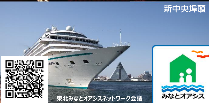
東北みなとオアシスネットワーク会議