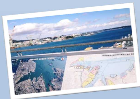
▲航空写真(左)&港湾計画平面図(右)

また、マリンゲート塩釜は、イベント会場としても使われており、地元や近隣の方々も多く訪れています。