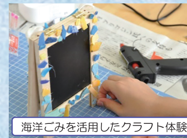
海洋ごみを活用したクラフト体験

カモンマーレ 総合受付 ・営業時間 9:00~17:00 (不定休) ・電話 0235-35-1217