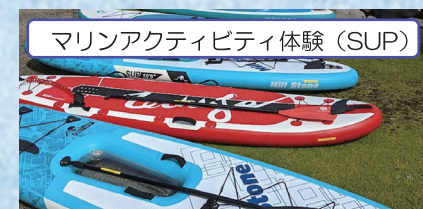
マリナクティビティ体験 (SUP)