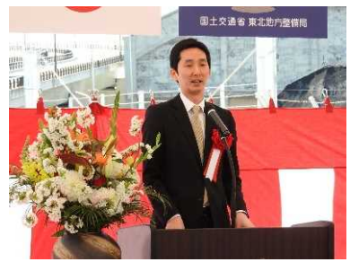
真山祐一 衆議院議員