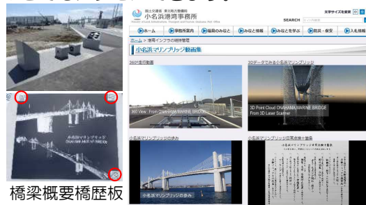
事務所ホームページの画面