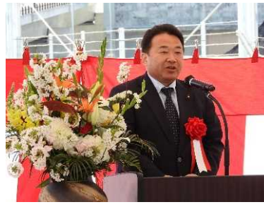
清水敏男 いわき市長