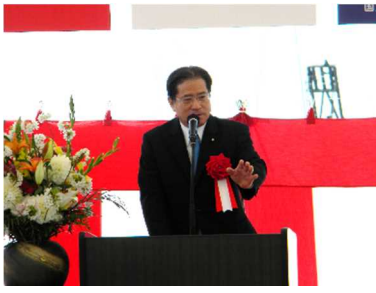
増子輝彦 参議院議員