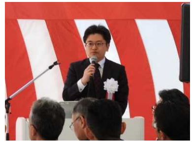
当事務所長による事業概要説明