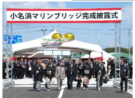
三世代夫婦による渡り初め