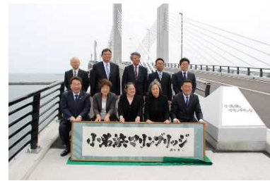
橋名板、原書と記念撮影