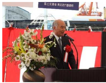
吉野正芳 衆議院議員