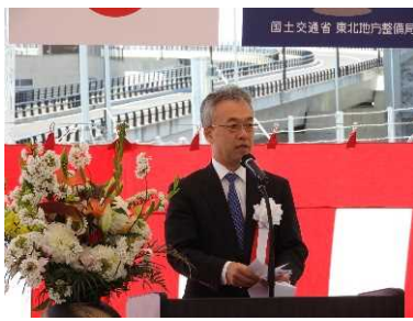
菊地身智雄 国土交通省港湾局長