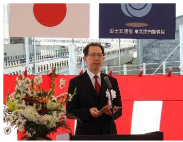
内堀雅雄 福島県知事