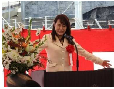
森まさこ 参議院議員