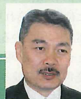
京都大学大学院教授・内閣官房参与 藤井 聡