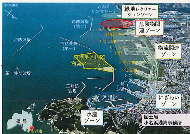
写真-2 「国際バルク戦略港湾」にも位置づけられる現代の小名浜港(平成28年1月)