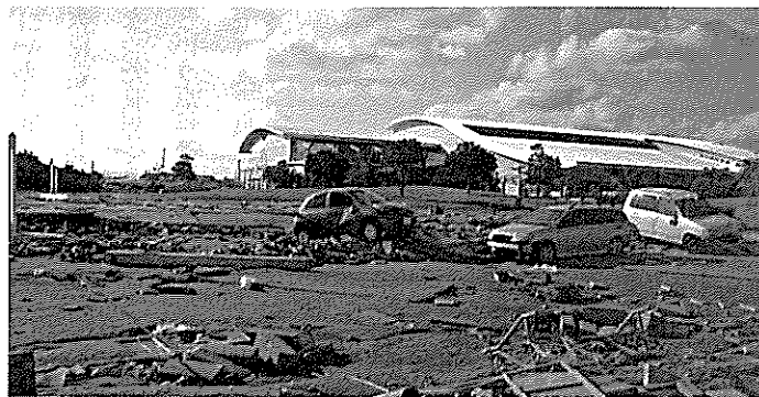
写真3 津波により被災した「いわき小名浜みなどオアシス」

小名浜マリブリッジは、周辺から工事の進捗状況が確認できるため、工事中から市民の注目を集めていたことから、名称を公募により決定するこ