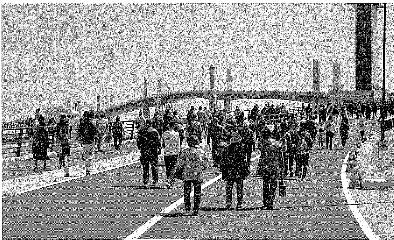
写真5 完成記念ウォークの様子(2017年4月23日)