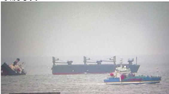
▲航走及び放水拡散作業状況(右手前「白山」)