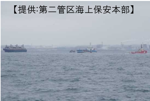
▲油回収作業状況 (左:C号 中央「白山」)