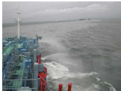
▲航走及び放水拡散状況(「白山」船上から)