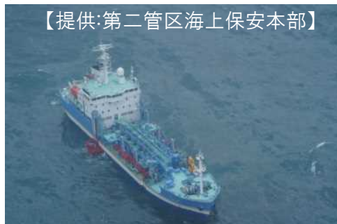
▲油回収作業状況「白山」