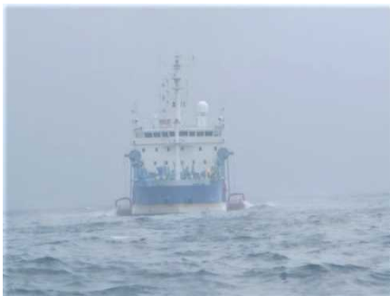
▲油回収作業状況（「白山」正面）