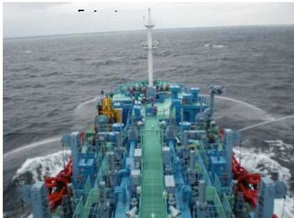
▲航走及び放水拡散状況(「白山」船上から)