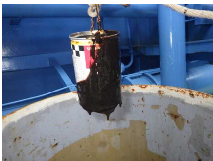
▲「白山」油水槽に回収した流出油