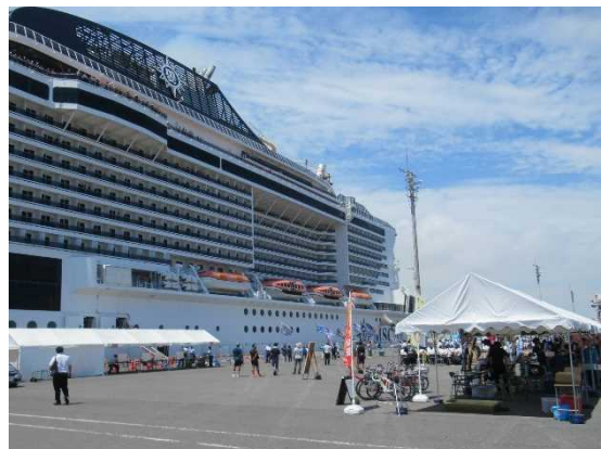
▲8/3 MSC ベリッシマ歓迎催事、お土産販売 (仙台塩釜港)