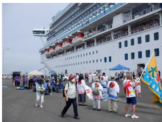
▲8/7 ダイヤモンド・プリンセスお出迎え (青森港)