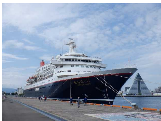
▲8/5 にっぽん丸 (青森港)