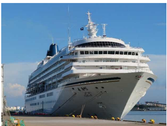
▲8/5 飛鳥Ⅱ (秋田港)