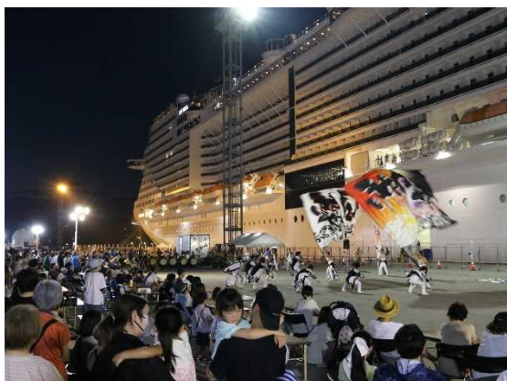
▲8/4 MSC ベリッシマお見送り (宮古港)