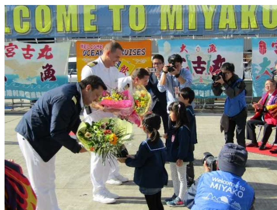
▲10/26 レガッタ 歓迎セレモニー（宮古港）