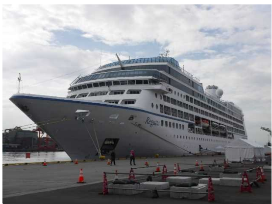
▲10/26 レガッタ（仙台塩釜港）