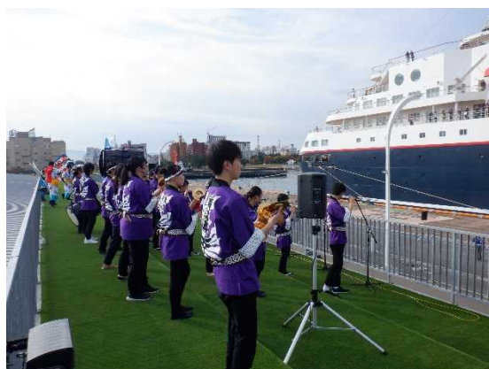
▲10/27 にっぽん丸 お出迎え（青森港）