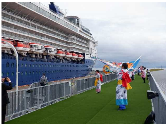
▲10/10 セブリティ・ミレニアム お出迎え（青森港）