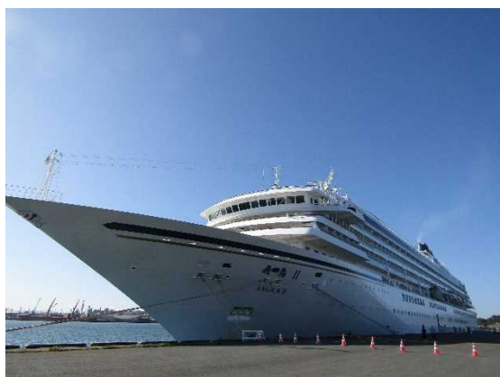
▲10/12 飛鳥 II（八戸港）