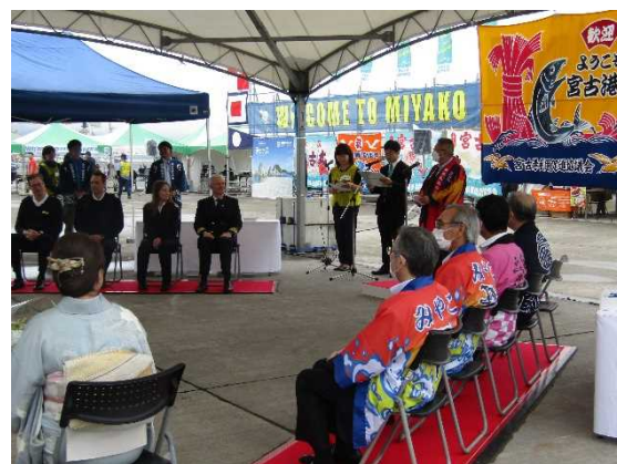
▲6/23 ハンセアティック・ネイチャー歓迎セレモニー（宮古港）