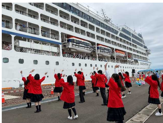
▲6/23 インシグニア（青森港）