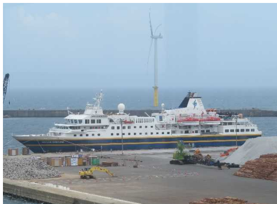
▲6/4 ヘリテージ・アドベンチャー（能代港）