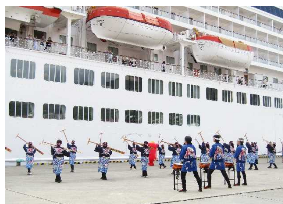
▲6/29 飛鳥Ⅱ歓迎催事（大船渡港）