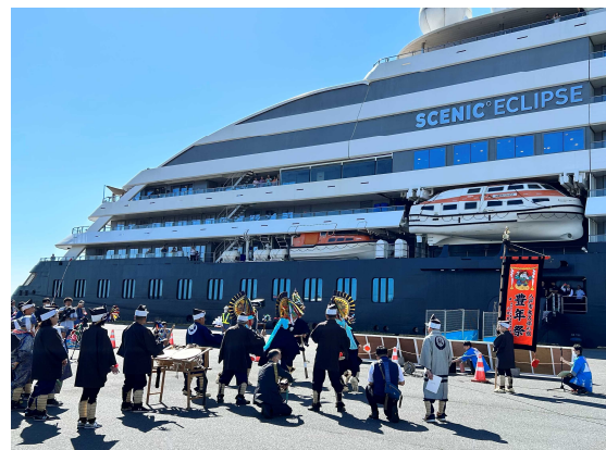
▲6/19 シーニック・エクリプス歓迎催事（八戸港）