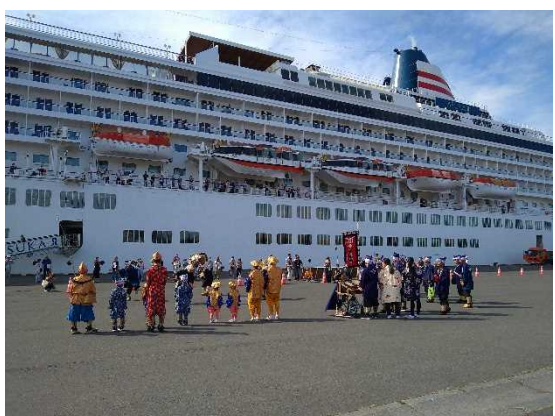
▲7/30 飛鳥Ⅱお出迎え（八戸港）