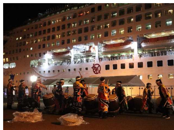
▲7/30 パシフィック・ワールドお見送り（仙台塩釜港）