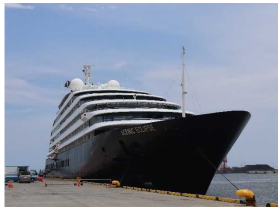
▲7/11 シーニック・エクリプス（仙台塩釜港）