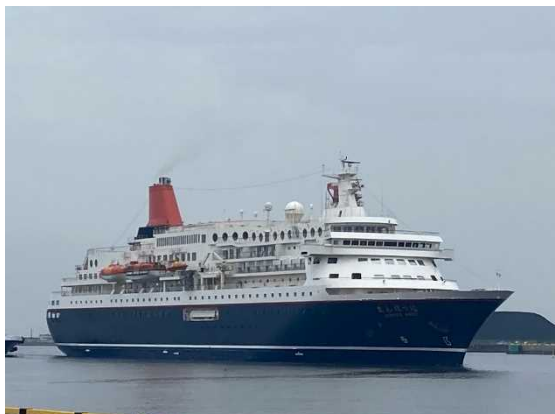
▲7/8 にっぽん丸（仙台塩釜港）