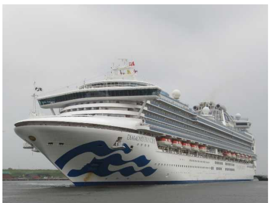
▲7/12 ダイヤモンド・プリンセス（秋田港）