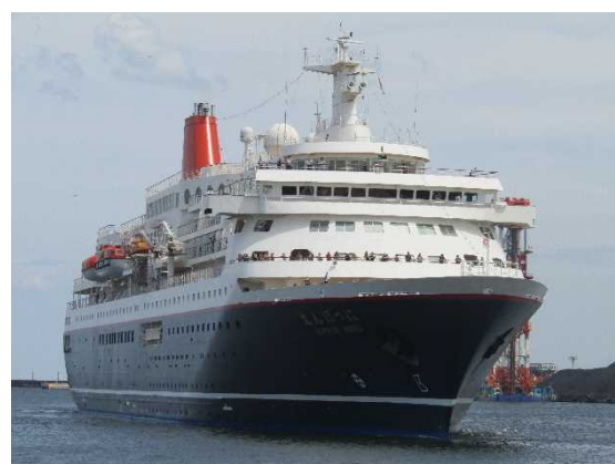
▲7/13 にっぽん丸（仙台塩釜港）