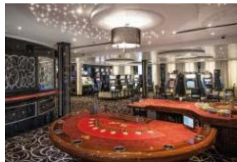
エクセルシオール カジノ