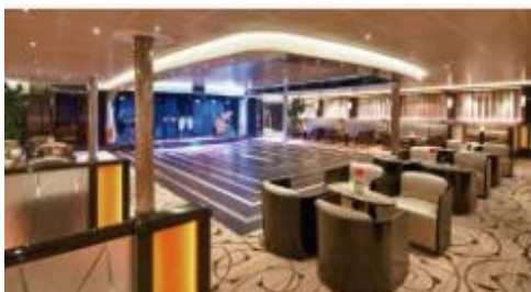
ビエンナキャバレー