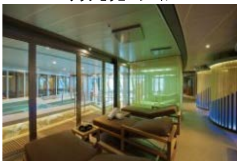
リラクゼーションエリア