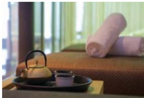
ジャパニーズティーハウス