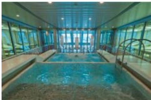
タラソセラピープール