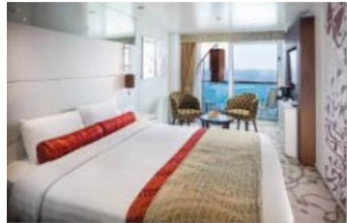
バルコニーデラックス