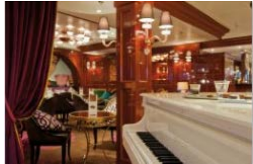
コーヒー&チョコレートラウンジ