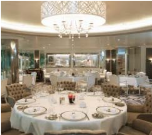
クラブ ネオロマンチカレストラン