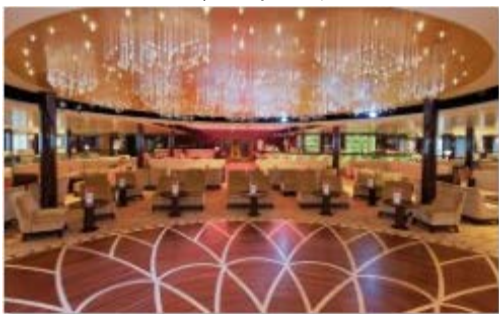
ピッツァイタリアグランドバー