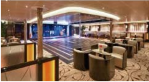
ビエンナキャバレー