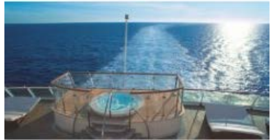
オープンエアジャグジー