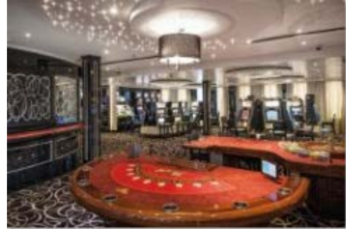
エクセルシオール カジノ