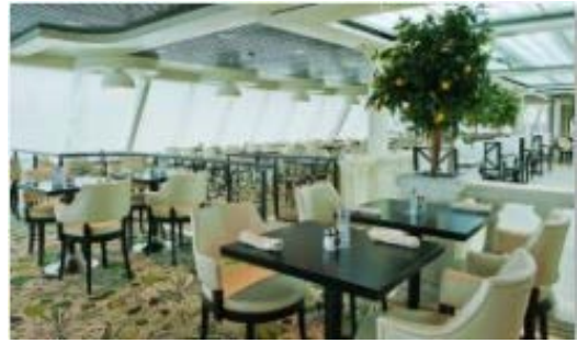
ジャルディーノ ブッフェレストラン