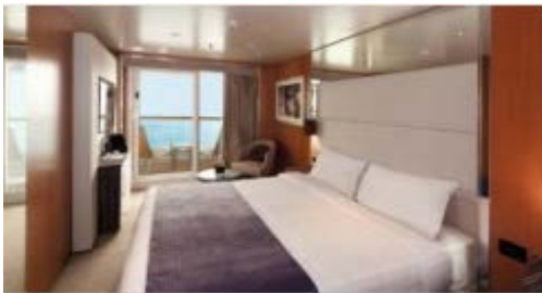
バルコニープレミアム