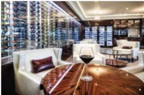
ベローナ ワイン&チーズバー