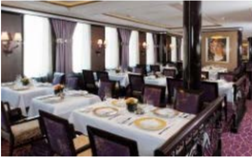
ボッティチェリ レストラン