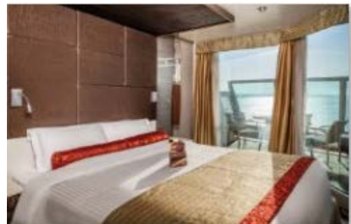
スイートデラックス(バルコニー付き)