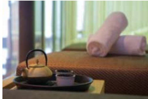
ジャパニーズティーハウス