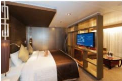
スイート(バルコニー付)