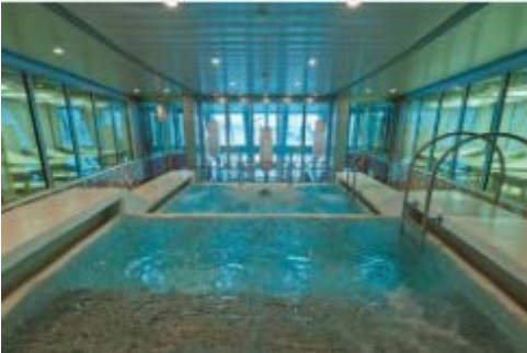
タラソセラピープール