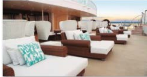
サントロペールバー