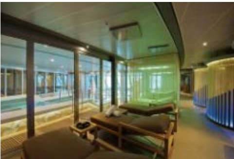
リラクゼーションエリア