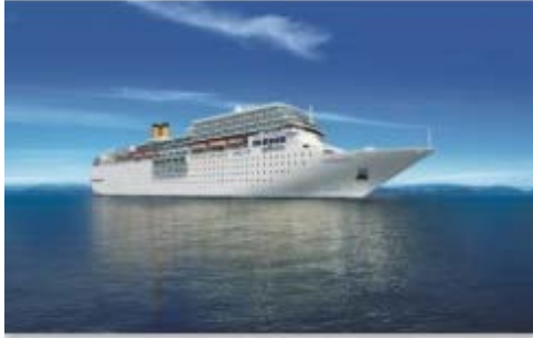
コスタ ネオロマンチカ