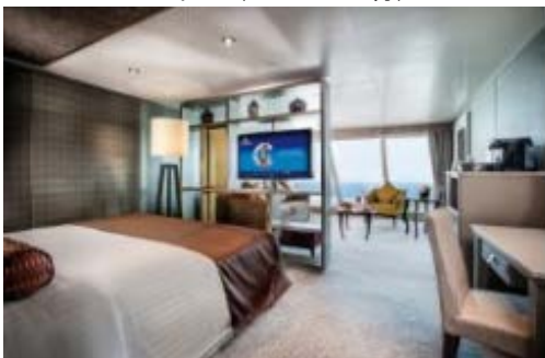
パノラマスイートデラックス