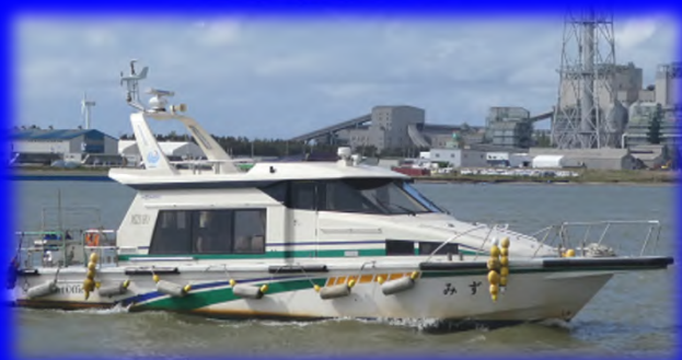
港湾業務艇「みずほ」