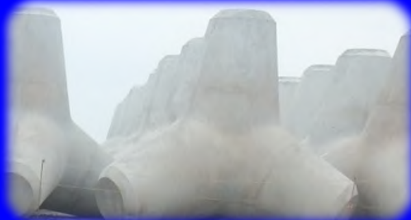
波消しブロック見学