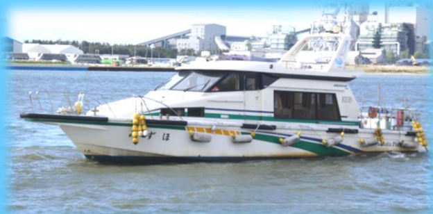
港湾業務艇「みずほ」

国交省業務艇「みずほ」で酒田港内を見学し、陸上では波消しブロックをご覧ください。