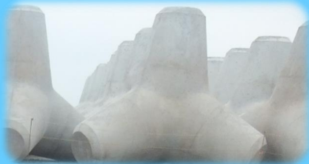
波消しブロック見学