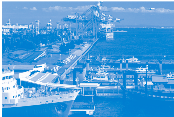
2011国土交通省港湾局長賞 「夏の波止場」(東京都江東区東京港) 樋口 徹