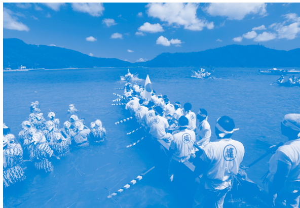
2011日本港湾協会会長賞 「塩屋のウングミ(海神祭)」(沖縄県大宜味村塩屋湾) おおき ゆうこう