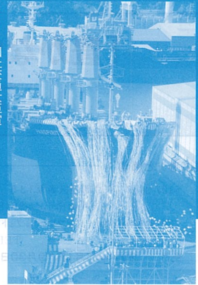
2013 国土交通大臣賞 「彩かなる進水式」(愛媛県今治造船所 大久保重義)