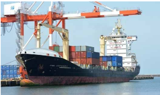
FPMC CONTAINER 8号