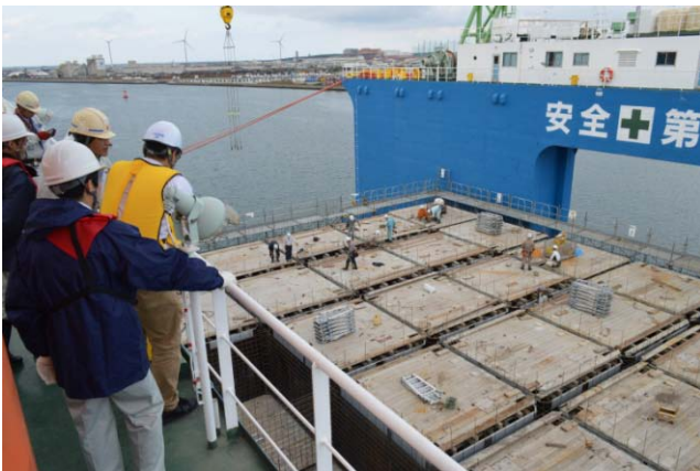
FD上部より型枠作成状況を見学