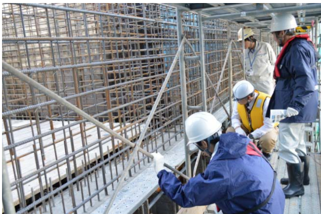
型枠作成前の、組まれた鉄筋が 見える箇所を見学