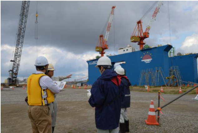
フローティングドック（FD）によるケーソン 製作工程について説明

11月6日（金）、報道関係者の方を対象に、酒田港防波堤ケーソン製作の現場見学会を開催しました。