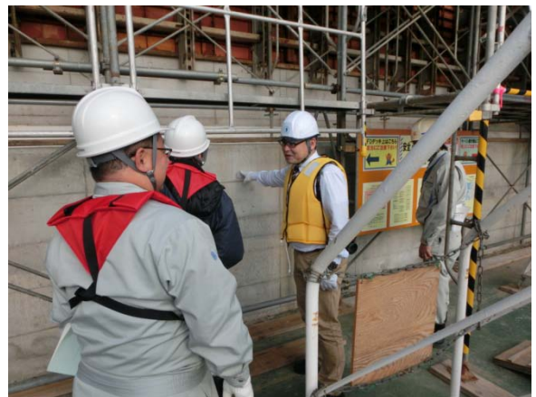
コンクリート打設が終わっている箇所を見学