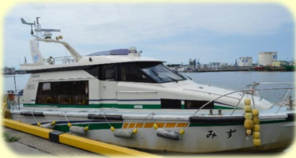
港湾業務艇「みずほ」