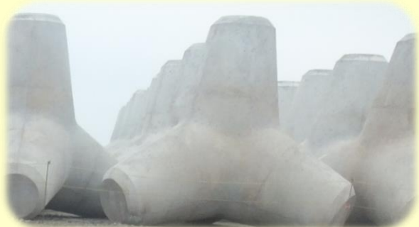
波消しブロック現場