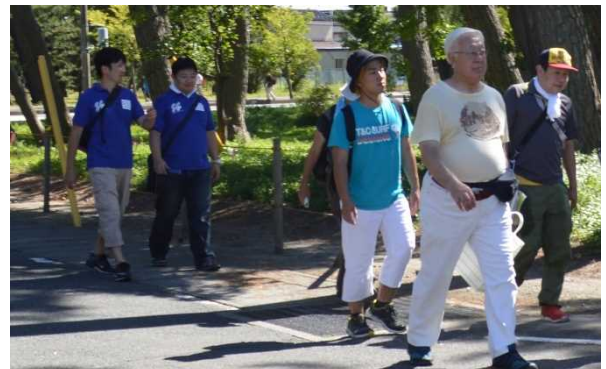
職員も参加者とともにコースを巡りました