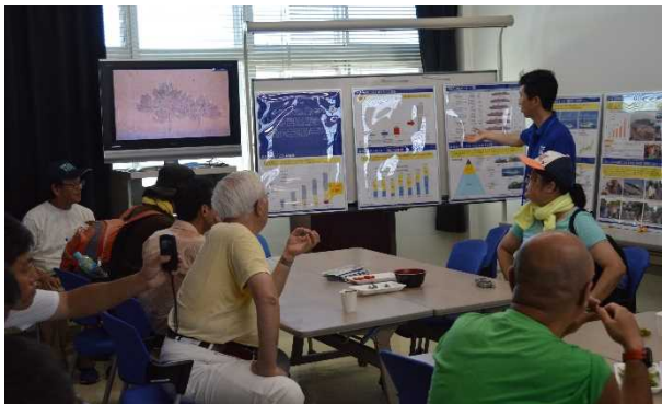
酒田港湾事務所での休憩中、クルーズ船について説明 酒田市からは「冷やし野菜」が提供されました