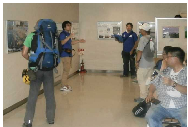
北港緑地展望台1階にてパネルの説明