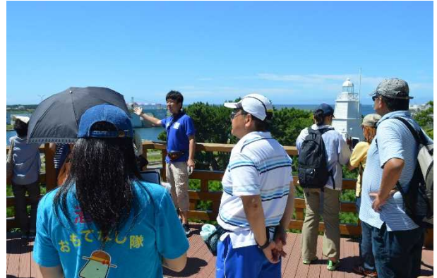
日和山公園で港の歴史や灯台などを説明