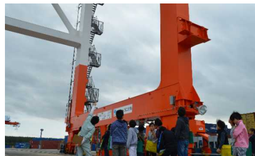
ガントリークレーンの働きを説明