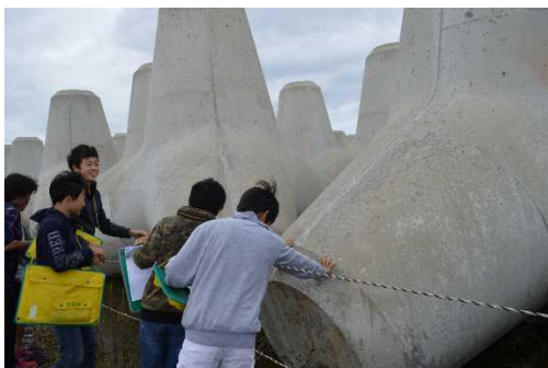
波消しブロックの大きさを体感