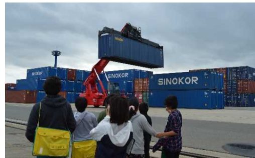
間近でコンテナ運搬作業を見学