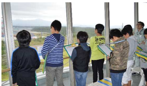
北港緑地展望台にて