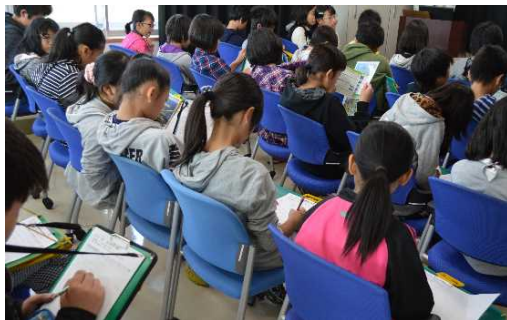
熱心にメモをとる姿も