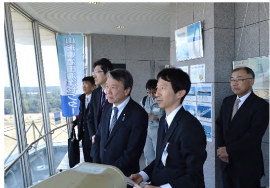
北港緑地展望台（酒田港国際ターミナル方向）