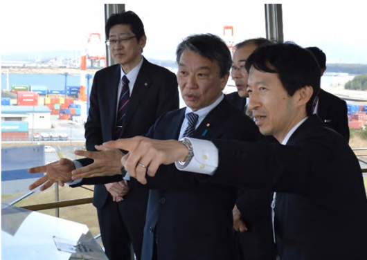
北港緑地展望台（防波堤方向）