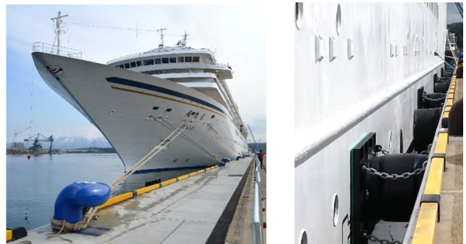
飛鳥II 寄港時の状況