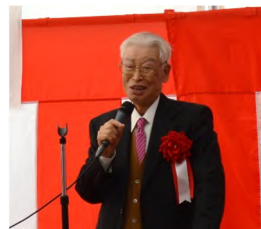
新田庄内開発協議会最高顧問 祝辞