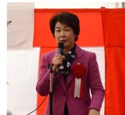
吉村山形県知事 祝辞