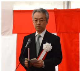
菊地港湾局長 主催者挨拶