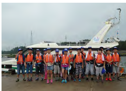
2班に分かれて記念撮影