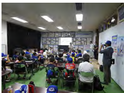
海洋センターにて概要説明

酒田港湾事務所では、リレーのアンカーを務めた酒田市立宮野浦小学校の4～6年生30名に、最上川と酒田港の関係の説明をした後、陸上では波消しブロック等の見学を実施し、海上では港湾業務艇「みずほ」に乗船しながら、酒田港の概要を説明しました。