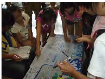
みんなでビッグフラッグに記入