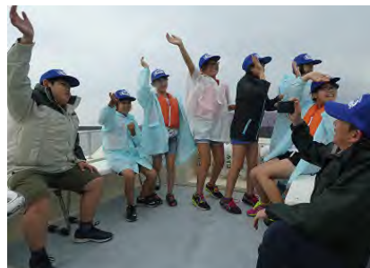
船上から陸上班の友達に手を振る