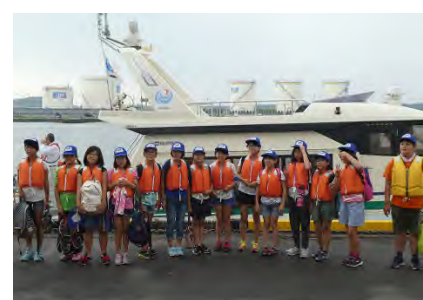
2班に分かれて記念撮影