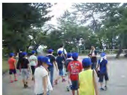
日和山公園を散策