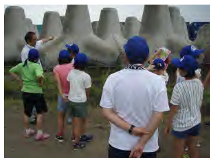
波消しブロック現場を見学